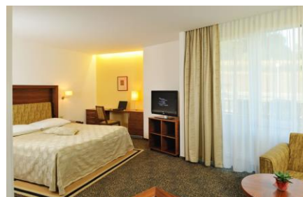
Standardna soba hotela Vitarium**** Superior

Usred šuma i travnjaka, u zaklonu zelenih brežuljaka Dolenjske leži odgovor na čovekovu žudnju za zdravljem i opuštanjem u prirodi. Terme Šmarješke Toplice su savremeno slovenačko termalno lečilište, poznato po vrhunskim uslugama lečenja i odabranoj ponudi najsavremenijih usluga medico wellnessa U Termama i njihovoj okolini je obilje mogućnosti za sportske i rekreativne delatnosti. Pored prostranog parka lečilišta, kroz koji vodi botanički put na raspolaganju su brojna šetališta za pešake, staze za šetače i bicikliste, golf teren na Otočcu sa 18 rupa, udaljen samo 4 km, sportski park sa četiri teniska terena, sa terenima za fudbal, košarku i odbojku na plaži, igralište za mini golf, teren za boćanje i prostor za piknike. Šmarješke Toplice udaljene su 460km od Beograd, 60km od hrvatske granice, 30km od Ljubljane, 10km od Novog Mesta.