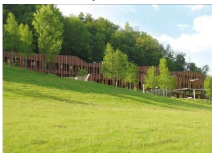
Wellness hotel Sotelia****