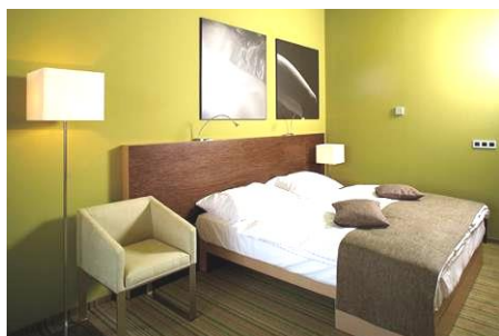
Standardna soba Wellness hotel Sotelia****