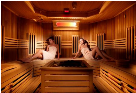
Grand Oaza Spa & Wellness centar - Sauna

Program boravka/putovanja i cenovnik broj 1 od 22.02.2013.