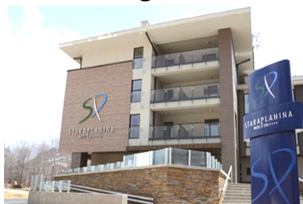
Falkensteiner hotel STARA PLANINA ****

Program boravka/putovanja i cenovnik broj 1 od 03.06.2013.